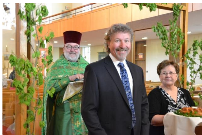
Pentecost/Green Holidays 2014

Our parish feast day / храм is coming up on June 12 . Since this is the first time in a couple of years that we are able to celebrate in person, our volunteers are busy planning some extra-special events and we look forward to hosting many of the Ukrainian newcomer families that we have gotten to know over the past few weeks.