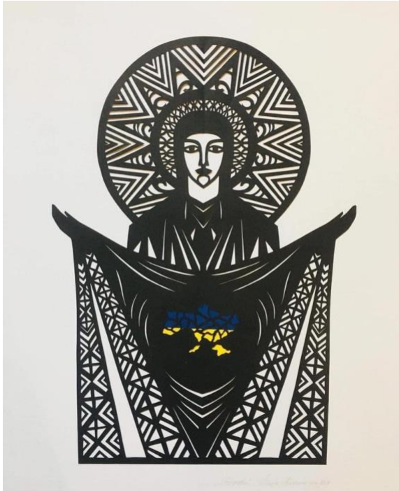
Artwork by Daria Alyoshkina